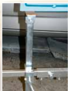
Stützfuß mit Gummiauflage für Montage- und Schleifarbeiten