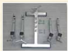
abnehmbarer Transportgriff mit Aufnahme für Adapter u. Schrauben