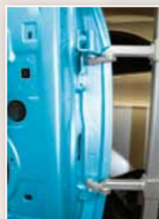
Adapter für Türen mit Scharnieren