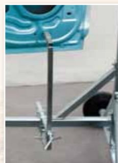
Halter für Türen ohne Innenverkleidung z.B Neuteile