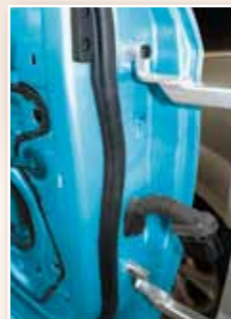
Adapter für Türen ohne Scharniere