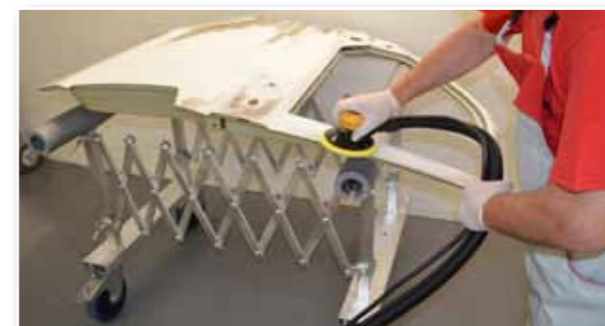
Leichtes bearbeiten einer Fahrzeugtür von allen Seiten.