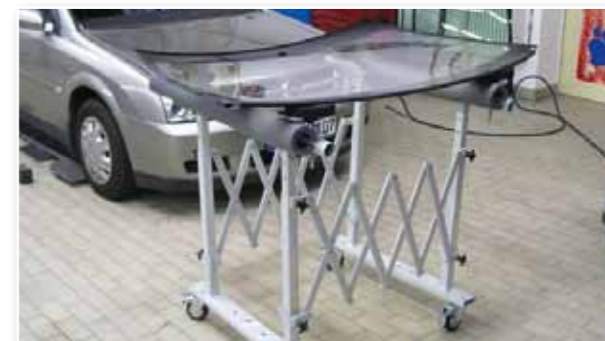
Sichere Auflage einer PKW-Scheibe durch Stützteller oder Schaumstoffauflagen.