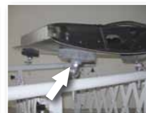
flexibel einstellbare Stützteller mit Schaumstoffauflagen.

Gern stellen wir Ihnen Ihren persönlichen PK-Vario Arbeitsbock nach Ihren Wünschen zusammen.