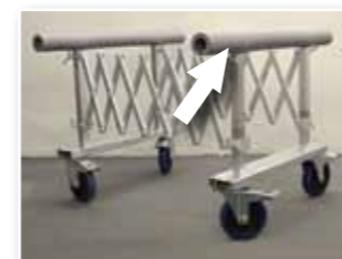
Schaumstoffauflagen auf den Tragholmen oder...