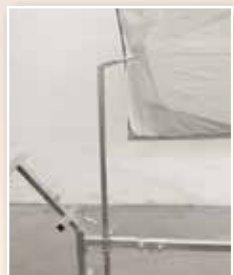
Halter für Türen mit Innenverkleidung