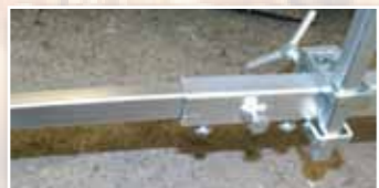
horizontale Verlängerung für breitere Fahrzeugtüren