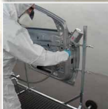
Innenlackierung ohne störende Quer- und Längsstreben